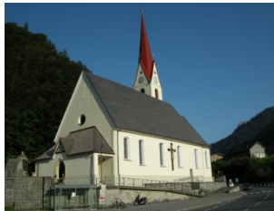
Au im Breg. Wald

Gott hat den Menschen zum Bild seines eigenen Wesens gemacht.